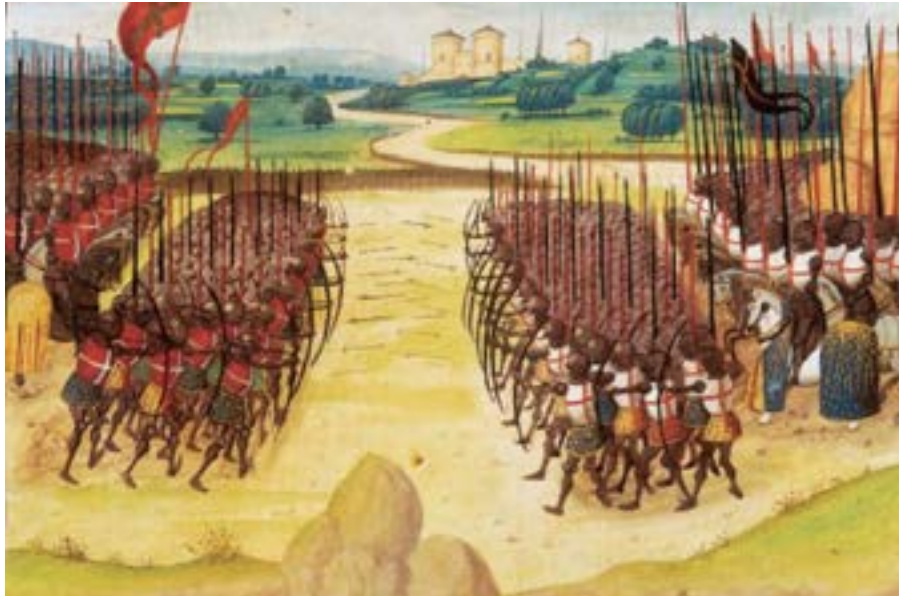
La guerre de Cent Ans, 1380-1440