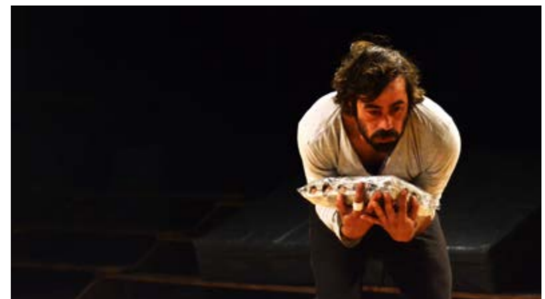
lancer d'une barquette d'oeuf.