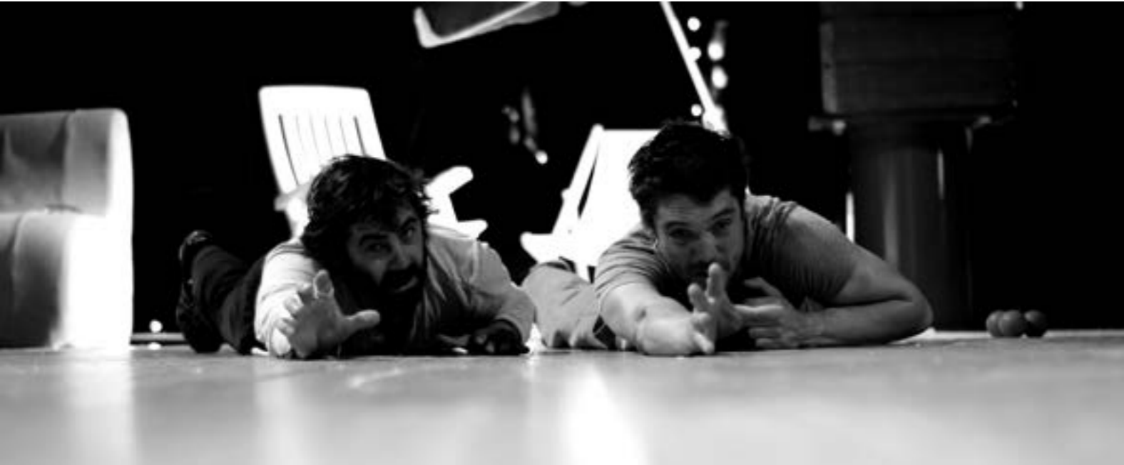
après la bataille