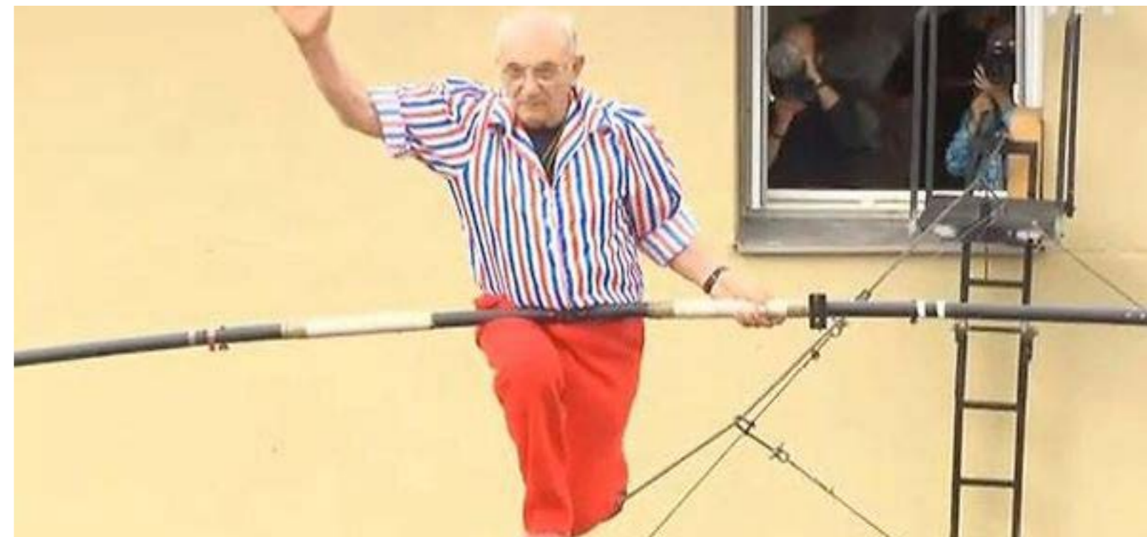
Henry's, le célèbre funambule lors de sa dernière traversée en public à l'âge de 82 ans.